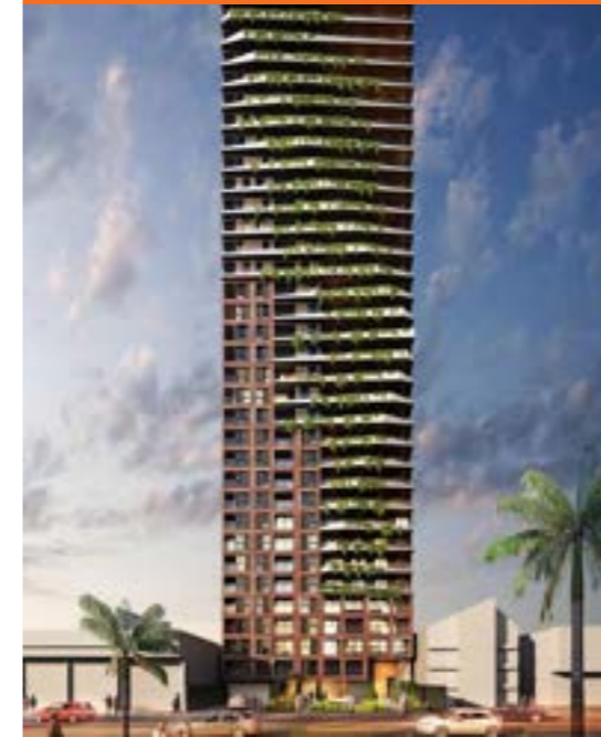
TREE SAN ISIDRO