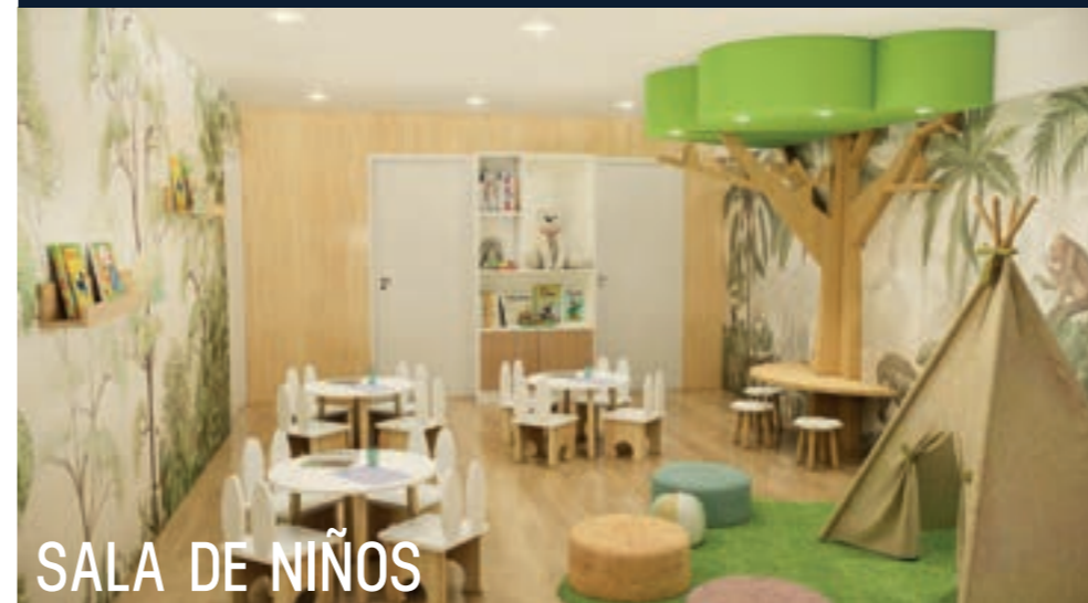
SALA DE NIÑOS

*Las imágenes y las vistas utilizadas son referenciales, ya que pueden presentar diferentes con el producto final.