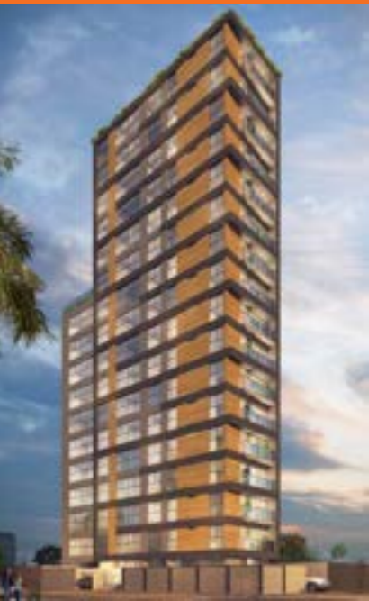
COSTANERA SAN MIGUEL