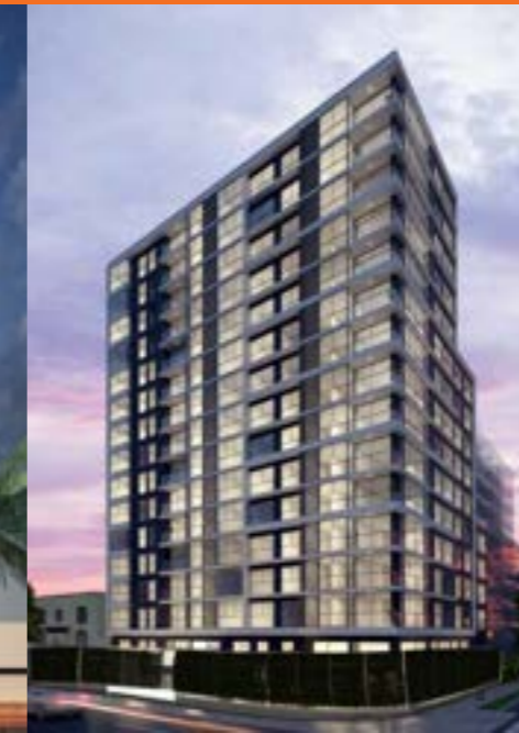
LIT SAN ISIDRO